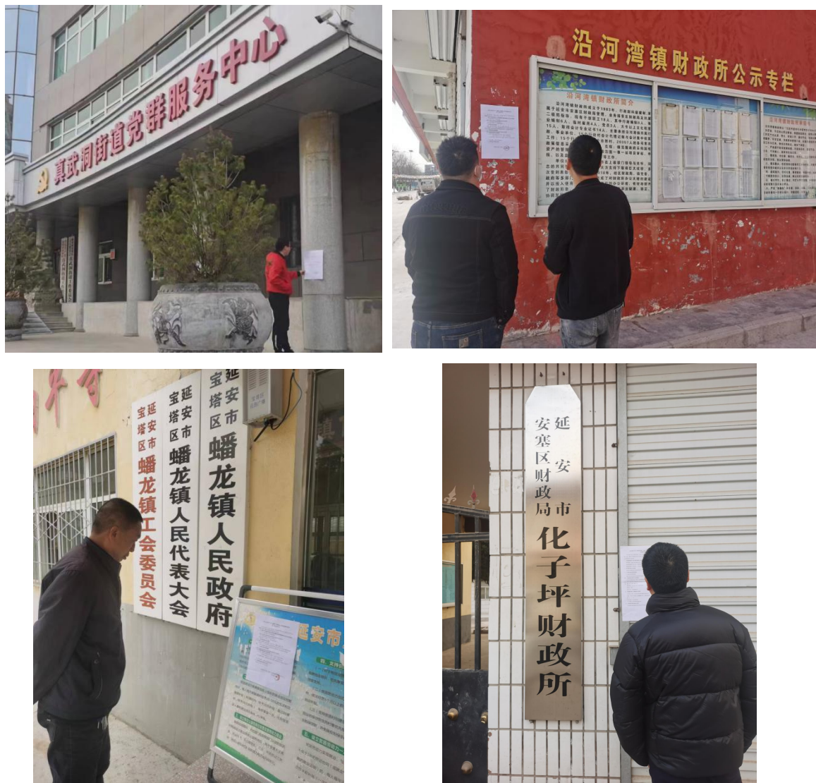
图 3-4 现场张贴公示照片

在 2023 年 3 月 15-16 日在蟠龙镇、真武洞街道、沿河湾镇政府公示宣传栏进行了张贴公示，公示情况见图 3-4。