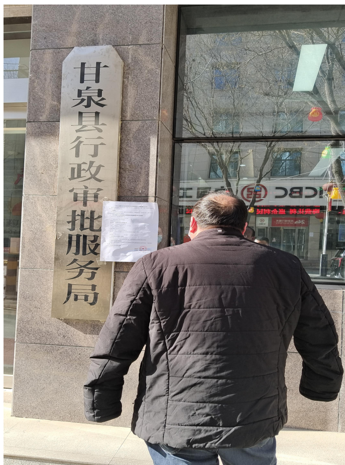
图 3-4 张贴公示照片