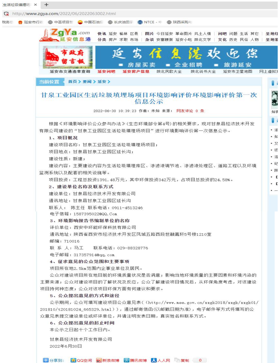
图 2-1 首次网络公示截图