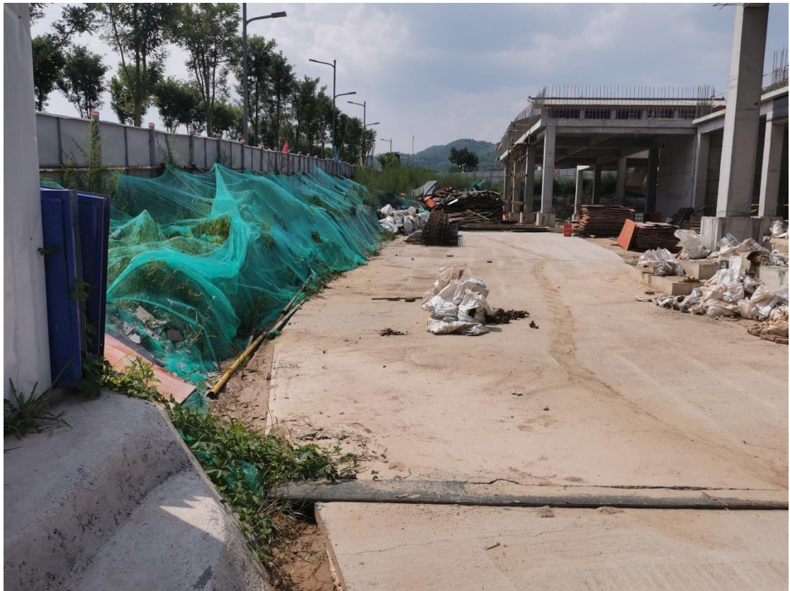
项目场地建设现状及苫盖措施