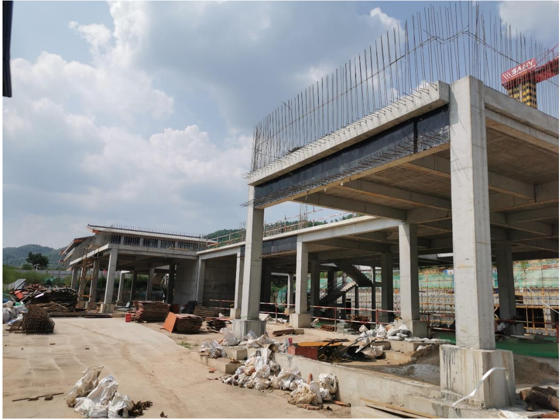
项目建筑物建设现状